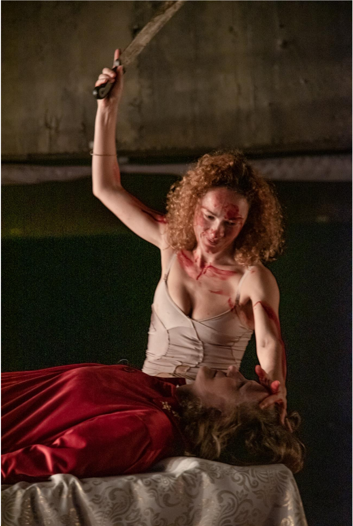
Mãe e filha em "Stabat Mater" - Foto de André Cherri