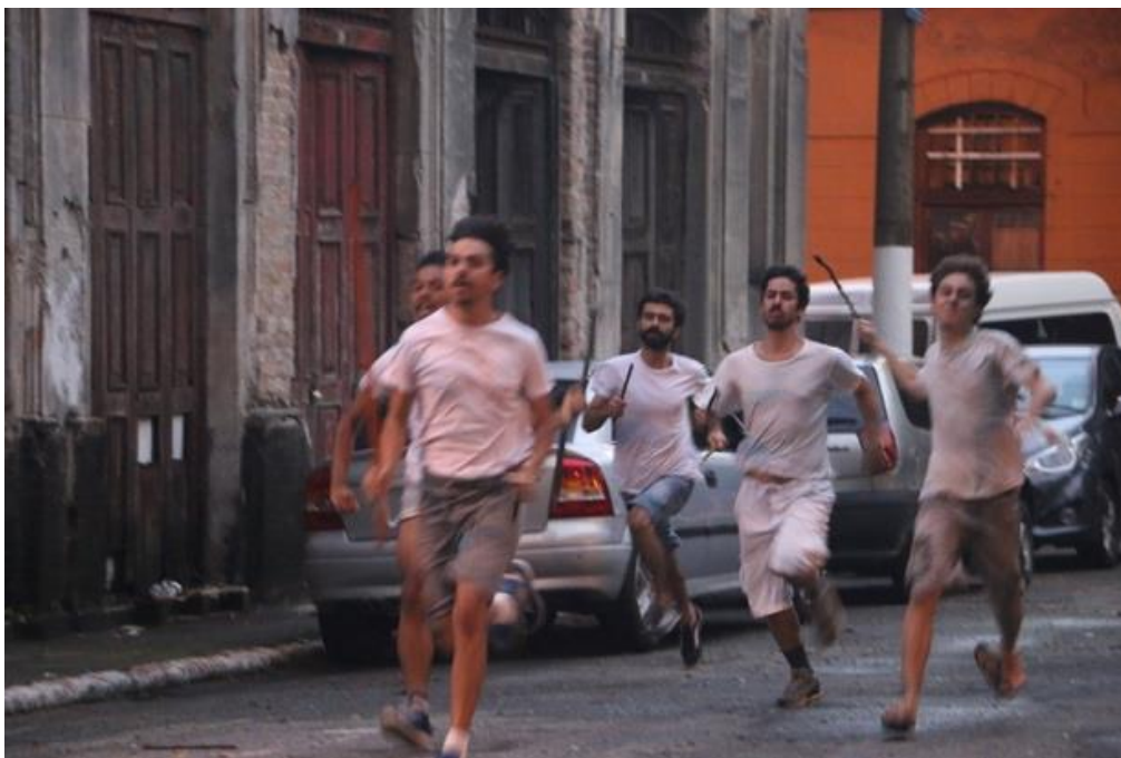
Feminino Abjeto 2 na Vila Maria Zélia

Apesar do senso comum que alia o abjeto ao “repulsivo”, o conceito mapeado por Kristeva em seu livro “Os poderes do horror” diz respeito a tensão dentro/fora, ou melhor, a uma dimensão fronteira já que, sem se tornar nunca um objeto (configurado pela oposição eu/outro) o abjeto remonta a uma crise narcísica que nos é fundante.