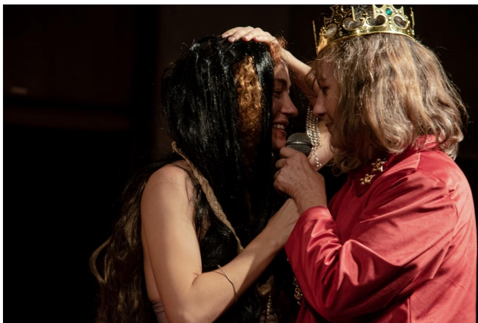
Mãe e filha em "Stabat Mater"

Ao mesmo tempo que isso parece apontar para uma zona de colapso do que entendemos como "teatral", me pergunto se não é exatamente disso que se trata enquanto busca estética. Afinal, como nos provoca Angélica Liddell, quem ousa dizer o que é o teatro?