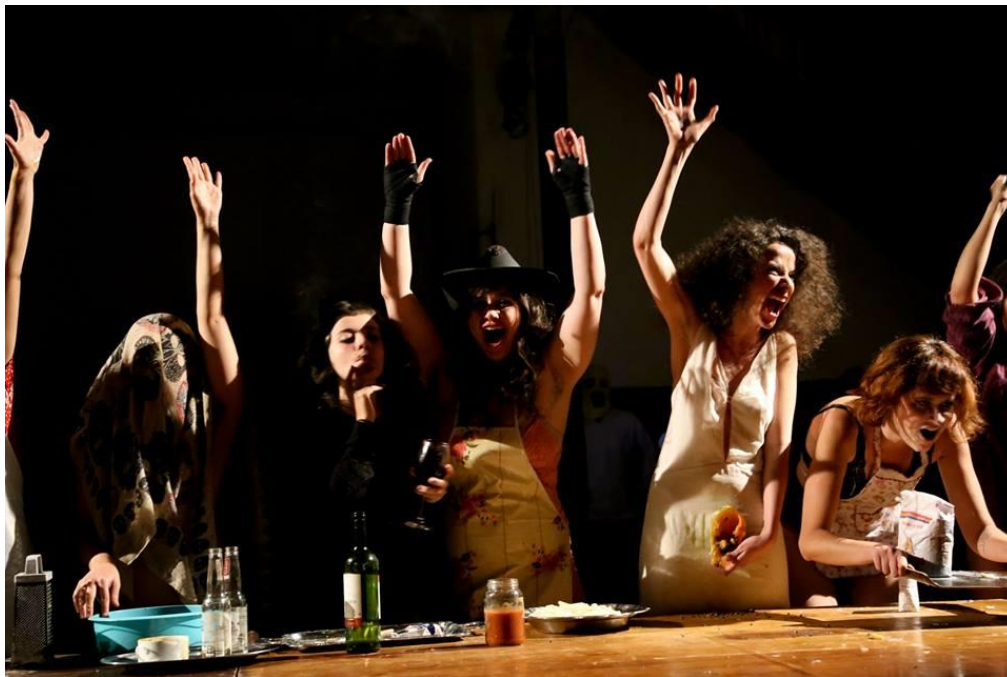
Feminino Abjeto 1

Essa espécie de insight biográfico deu origem a três investigações que envolveram quase cem artistas: "Feminino abjeto 1" (2017), "Feminino Abjeto 2 – O vórtice do masculino" (2018) e "Stabat Mater" (2019). Olhar para a mãe e o feminino , abriu as portas para um dos conceitos mais instigantes que encontrei até aqui, a abjeção, formulado por Julia Kristeva a partir do pensamento de Melanie Klein.