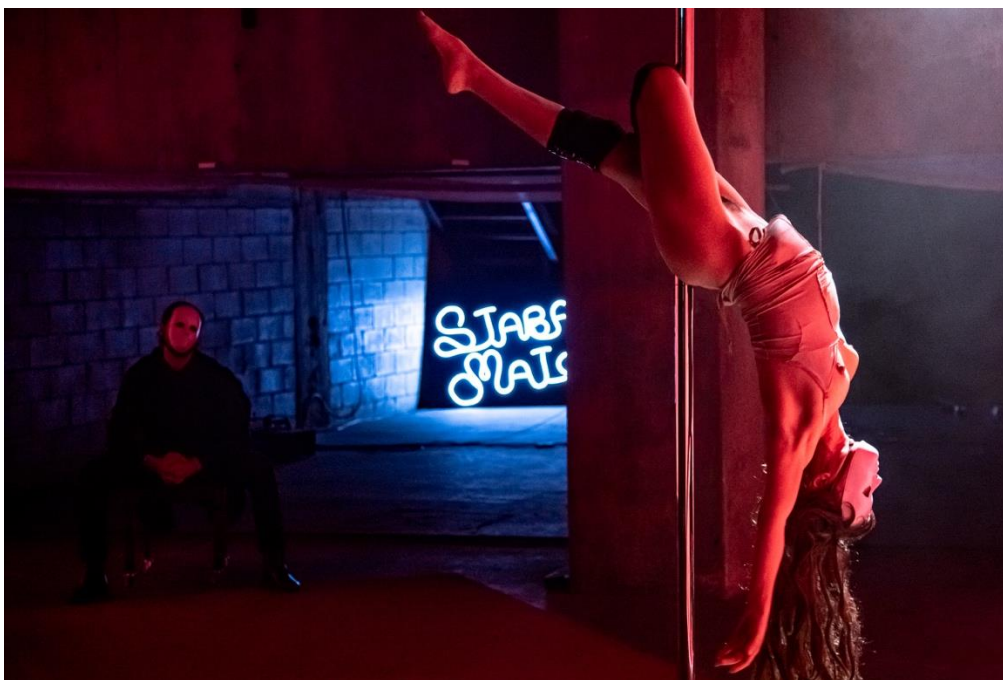
"Stabat Mater"

A partir dessa tese, a peça parte de um jogo de dramatização ou psicodramatização de memórias e sonhos, além do material teórico de uma suposta palestra, para investigar o tropo do corpo da mulher como receptáculo. Seja nos contos de fada em que a princesa é visitada pelo príncipe, ou ainda, nos filmes de terror, por monstros e demônios, a imagem de um corpo inerte, de uma mulher que dorme, é um lugar comum da mitologia à cultura de massa.